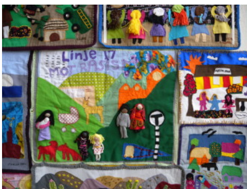
Motståndsbroderiet av Feministas migrantes latinoamericanas.

«Kommunens stora sociala åtgärd var dess egen arbetsfyllda existens», sa Marx om den kortlivade Pariskommunen. Utan övriga paralleller till de 72 dagar under 1871 då Paris styrdes som en arbetarkommun, säger citatet ändå något om den sociala och konstnärliga skärpan i Högdalens folkets hus. Allt från pensionärer till barnfamiljer har engagerat sig i diskussioner om husets framtid, och även om sannolikheten för en permanent institution är små, så kan det framhållas att även den ursprungliga Folkets hus-rörelsen i 1800-talets Sverige mötte motstånd, konflikter och tillfälliga nederlag i kampen om arbetarrörelsens egna möteslokaler. Och bara det faktum att diskussionen nu har väckts som en «arbetsfylld existens» kan betyda nog så mycket.